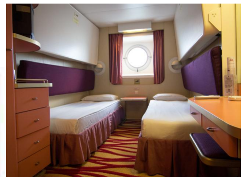
โอเชียนวิว สเตทรูม OBSTRUCTED VIEW