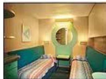
อินไซด์ สเตทรูม