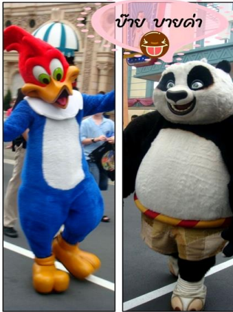
บ๊าย บายด้า

- “ ที่ขีดเส้นใต้คือผ่านชมและหรืออาจมีค่าเข้าชม ”