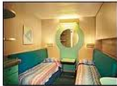
อินไซด์ สเตทรูม