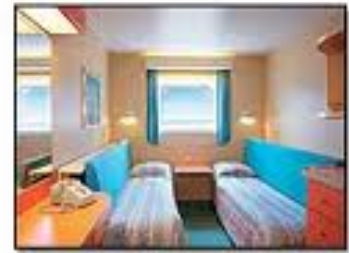
โอเชียนวิว สเตทรูม OBSTRUCTED VIEW